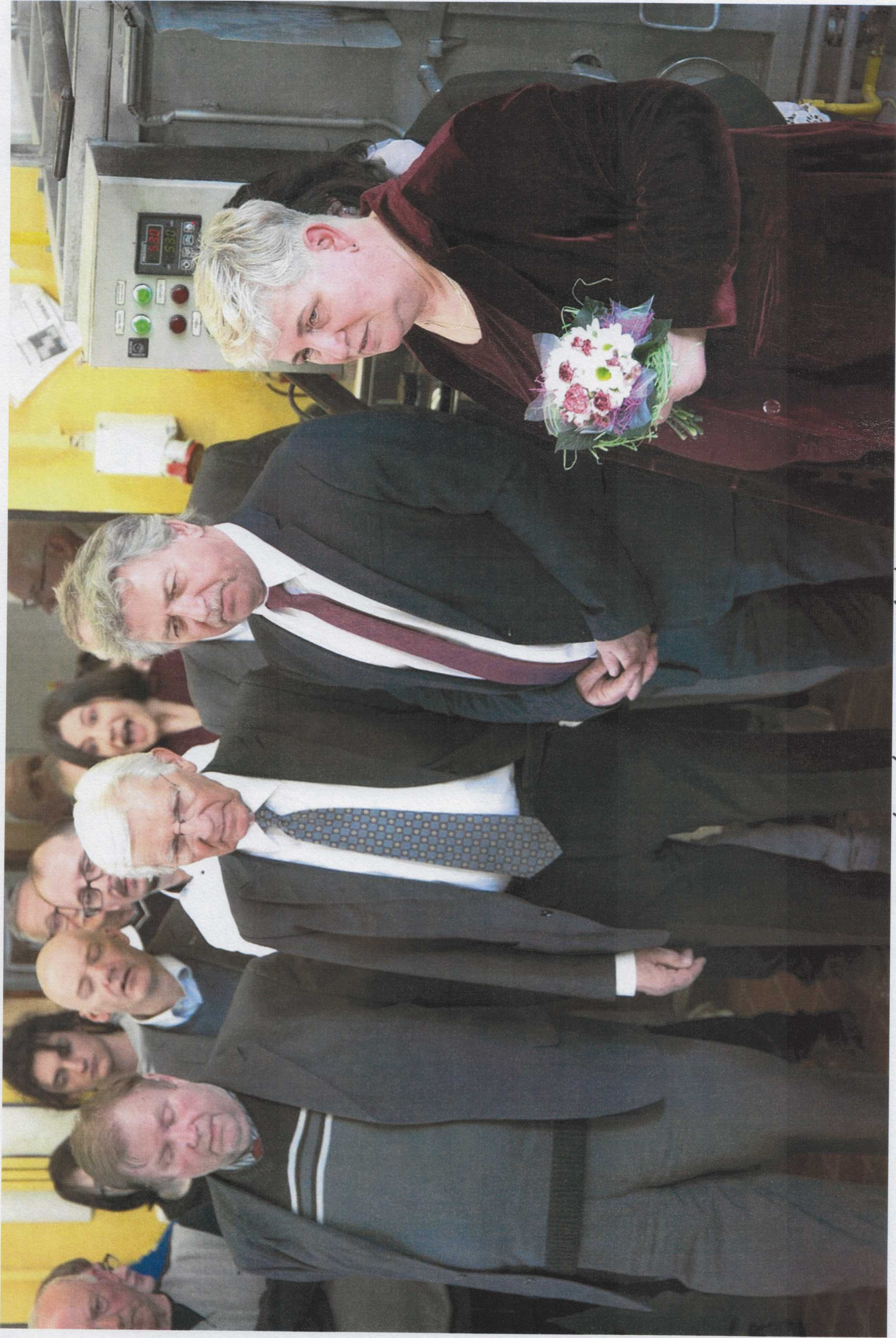
45. VÝROČÍ KALOŘENÍ PRACÍ