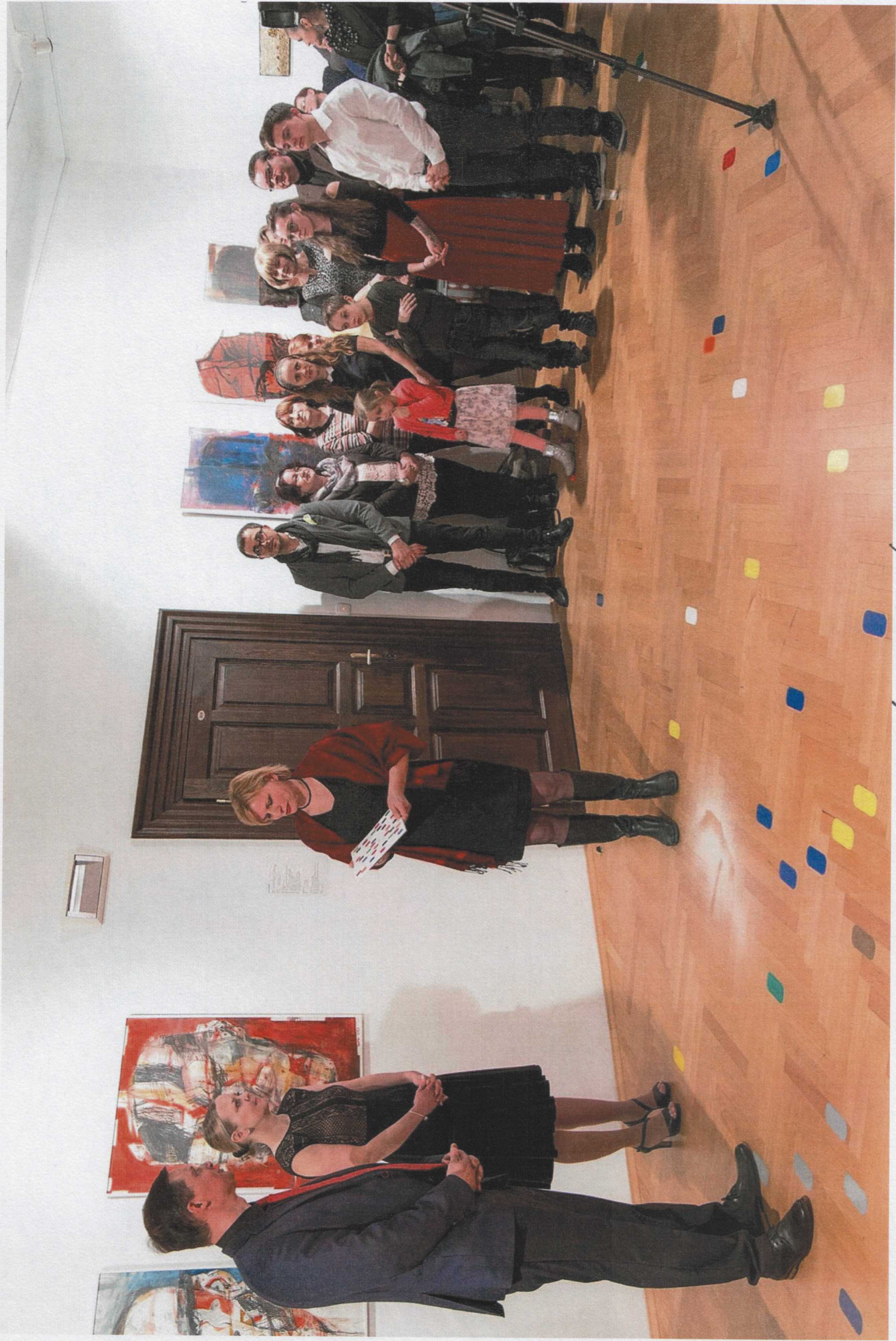
75. VÝROČÍ KALOŠENÍ TRAVY