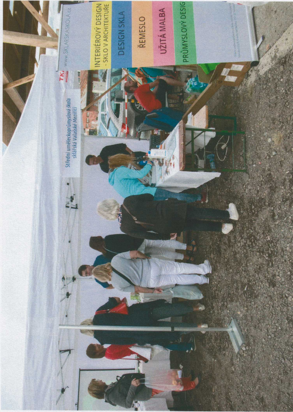
DEN ŠKLÍNSKÉHO KRAJE