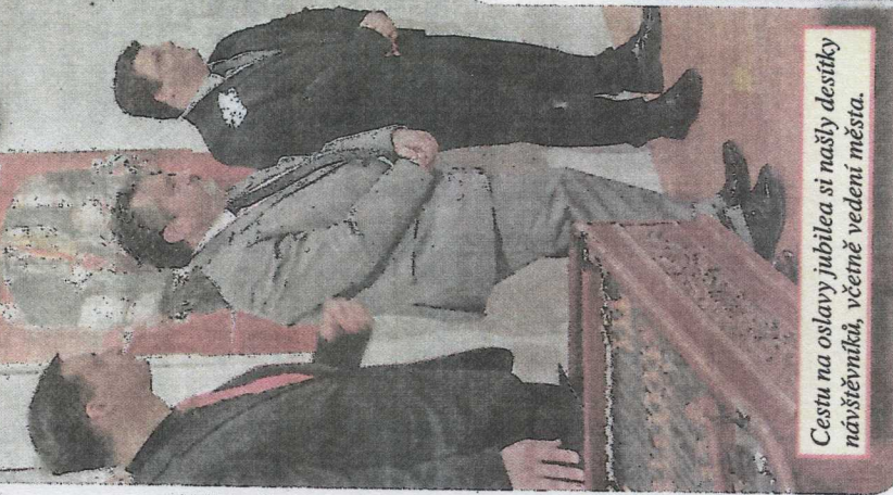
Cestu na oslavy jubilea si našly desítky návštěvníků, včetně vedení města.