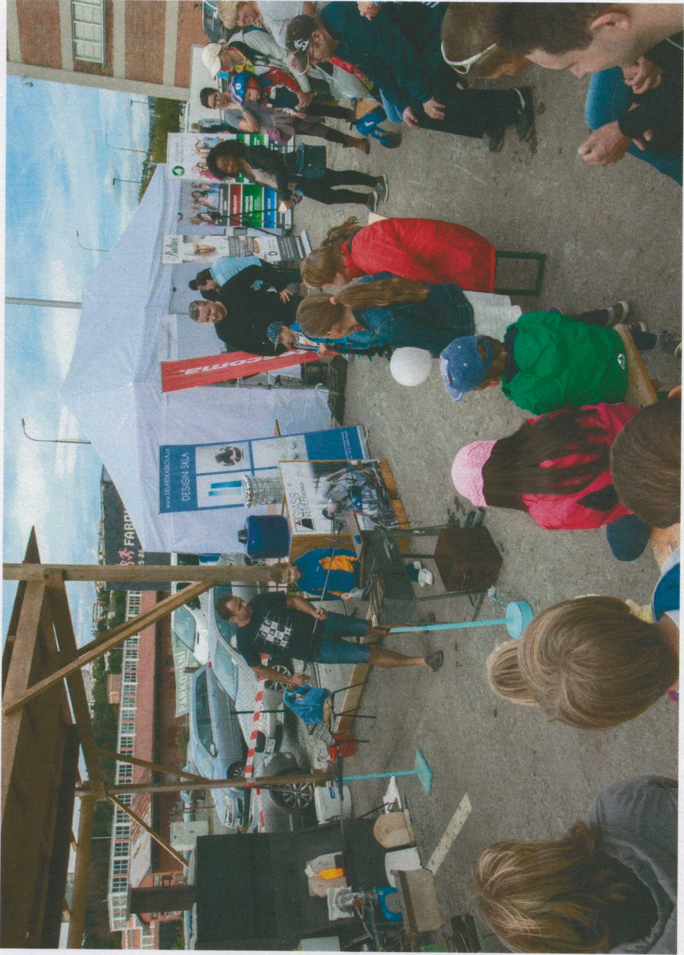
DEN KLÍNSKÉHO KRAJE