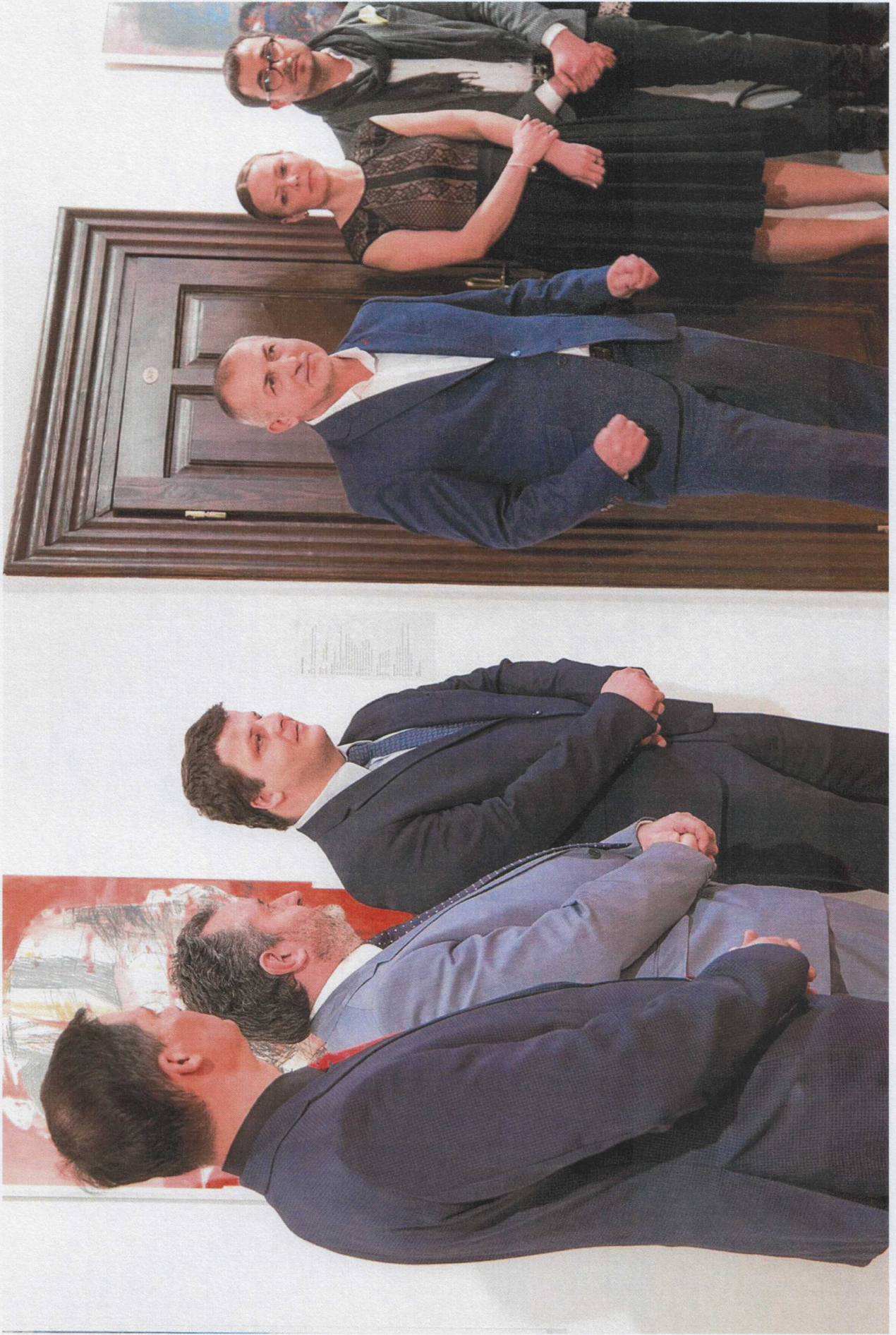
45. VÝROČÍ GALOŽENÍ IKALY